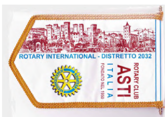
Fanion du Rotary Club Asti

Le club d'Asti : fondé en 1950, il est le benjamin du groupe contact. Quoique dans sa soixantième dixième année. Le club compte environ 90 membres. Nous n'avons pas eu de trombinoscope mais les échanges avec nos amis italiens nous ont permis de percevoir une composition proche des clubs d'Interlaken et de Friedrichshafen-Lindau. Ce club peut facilement remplir un bus. Les chansons et les plaisanteries ont contribué à un déplacement Asti/Interlaken agréable. Bien différent des contraintes de la conduite automobile individuelle pour la petite délégation envoyée par notre club.