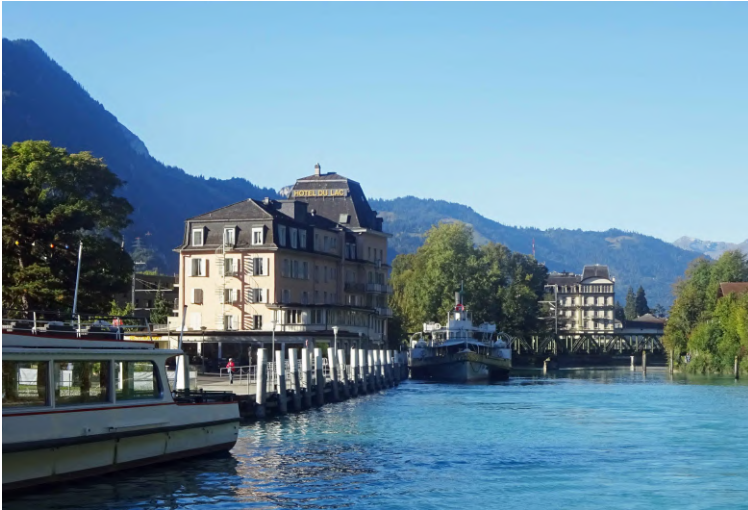
L'hôtel du Lac. Interlaken, 11 octobre 2019.