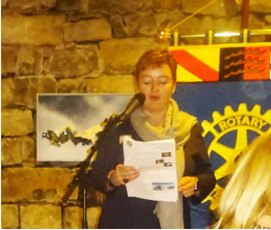
Le discours protocolaire de la Présidente du club Interlaken.