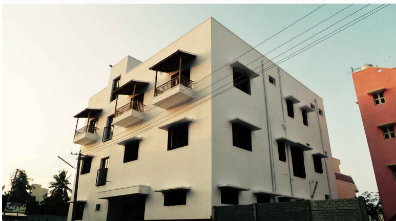
La Maison d'Agathe (Pondichéry).

2- Rassemblement d'Interlaken (11 au 13 octobre) : le club d'Interlaken reçoit cette année à domicile, les trois autres clubs contact : Asti, Friedrichshafen-Lindau et nous mêmes.