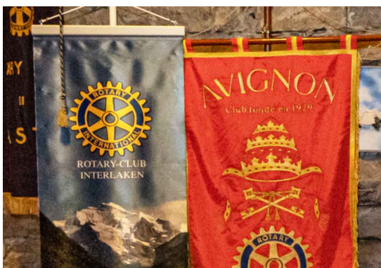
Drapeaux des clubs Interlaken et Avignon. 11 octobre 2019.