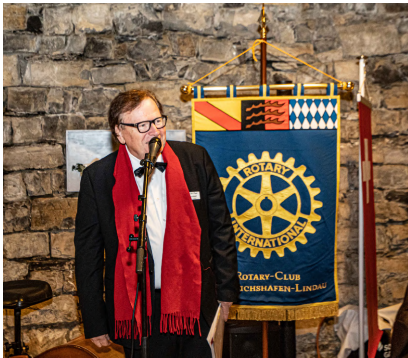
Discours du Président du RC Avignon.