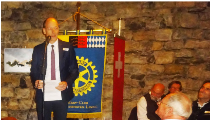
Le discours protocolaire du Président du club Friedrichshafen-Lindau.