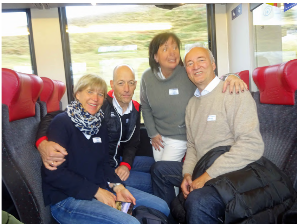
Avec nos amis allemands, en ascension sous la roche au cœur de la montagne.