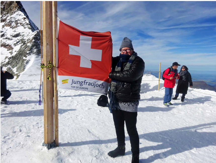
Le Président du Rotary Club Avignon sur « le toit de l'Europe ». Jungfraujoch, 12 octobre 2019.