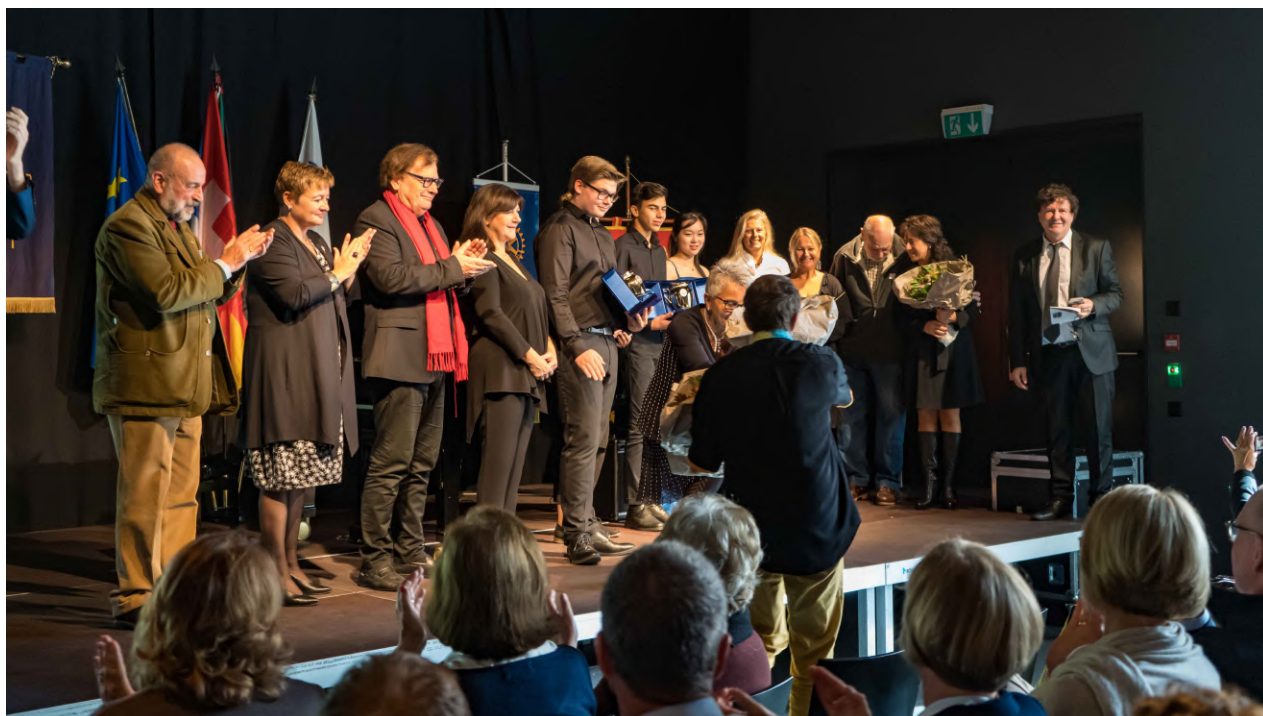
Remise de la Douja d'Or, quatorzième édition, à Interlaken, le 13 octobre 2019.

Vient le moment de la séparation. Les Rotariens s'étreignent chaleureusement en se promettant de se retrouver l'année prochaine à Asti.