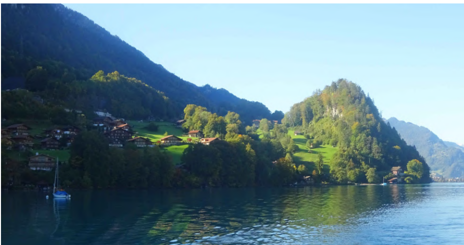
Jeux de lumière sur le lac de Brienz. 11 octobre 2019.