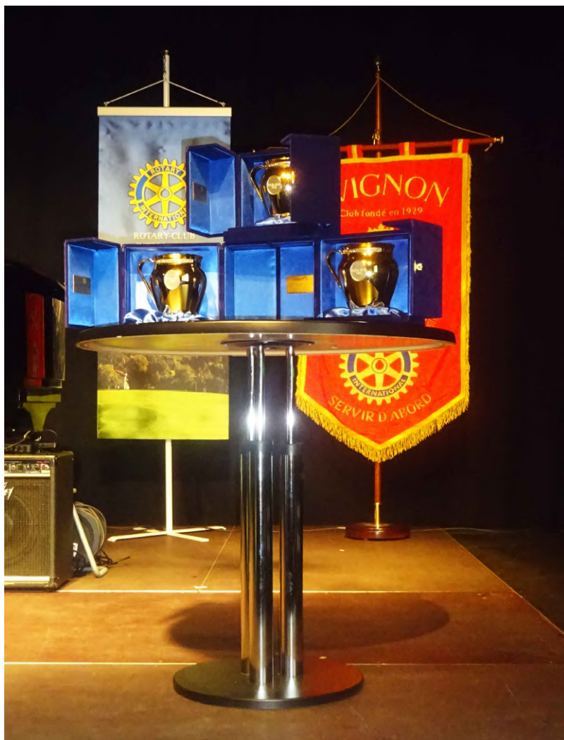
La Douja d'Or, Interlaken, 13 octobre 2019.

En conclusion : Interlaken fut un moment réussi, exemplaire, au cours duquel la courtoisie, l'amitié et la bonne humeur ont été omniprésentes. Bravo et merci aux organisateurs qui ont bâti une rencontre à la logistique millimétrée, qui ont si bien su restituer l'esprit Rotarien. Les échanges ont été très riches, en conformité à une forme d'humanisme qui a uni les hommes de qualité à certains moments de l'histoire de l'Europe. Être Rotarien, c'est d'abord être un homme ou une femme de qualité.