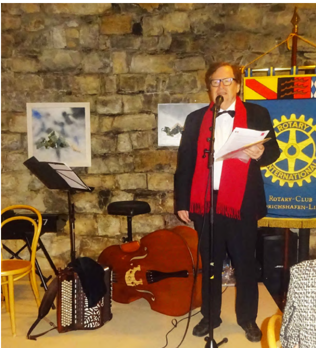
Le discours protocolaire du Président du club Avignon.

Retentit ensuite la Marseillaise dont les paroles sont chantées par la délégation d'Avignon. Le Président du club d'Avignon prend la parole.